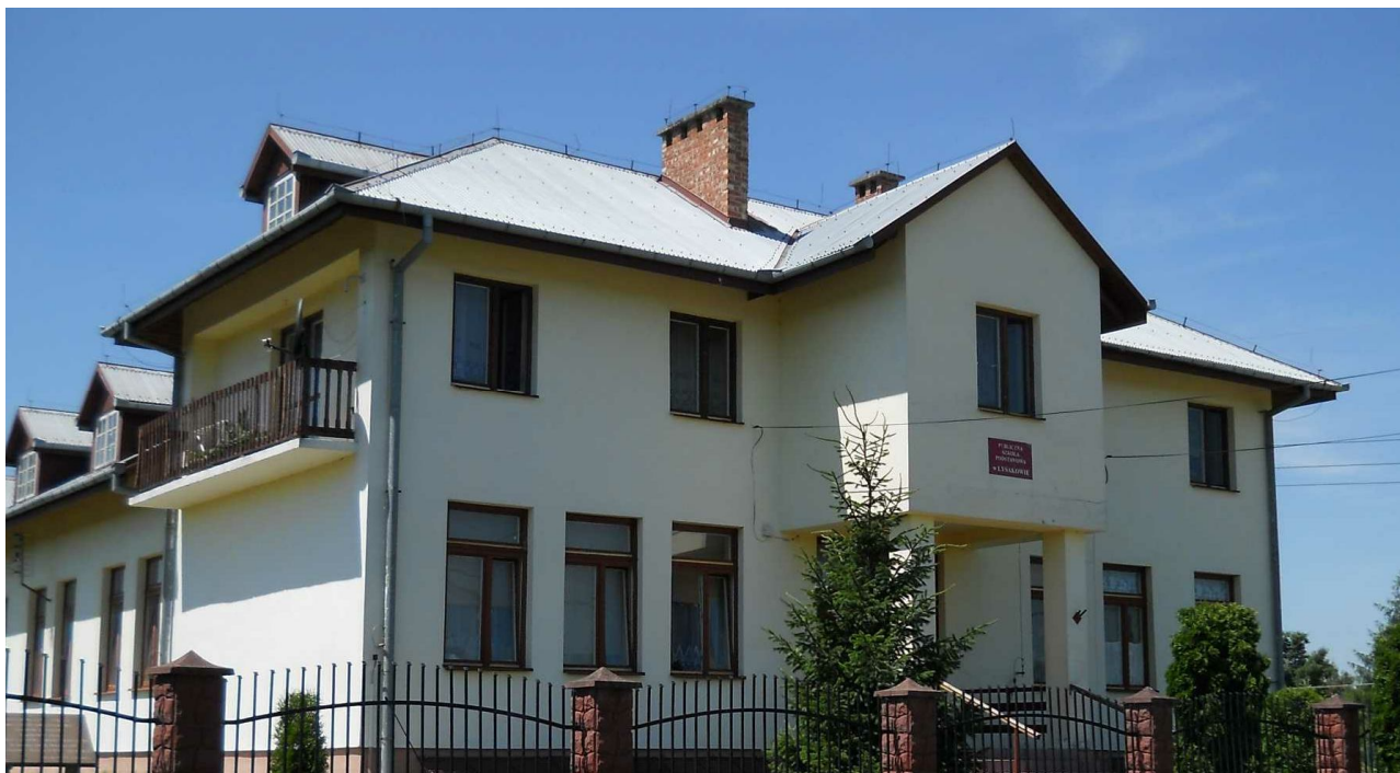
Budynek niepublicznej Szkoły Podstawowej i Niepublicznego Gimnazjum w Łysakowie