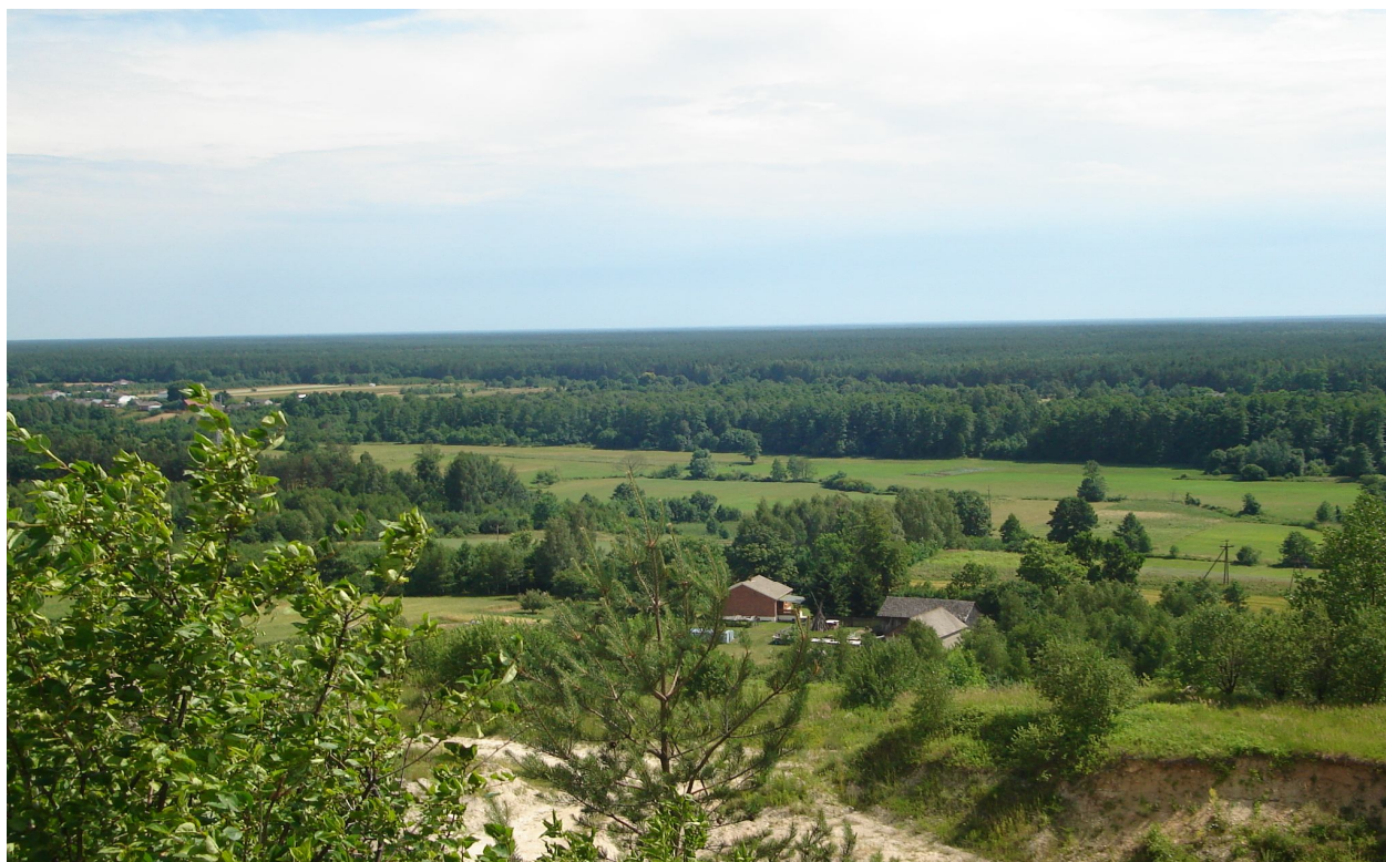
Widok na kompleks Lasów Janowskich ze starego kamieniołomu.