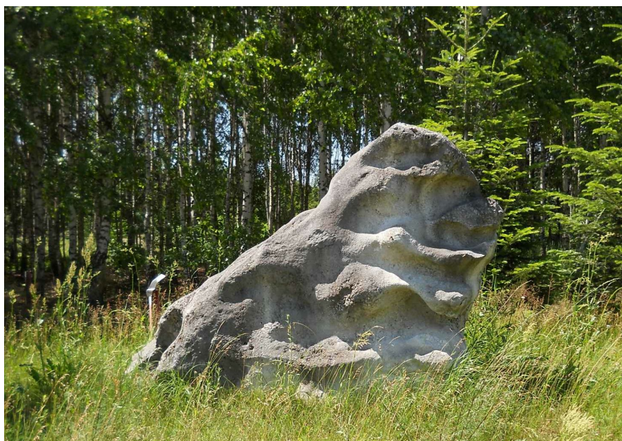
Wyrzeźbiony przez wodę kamień w centrum wsi