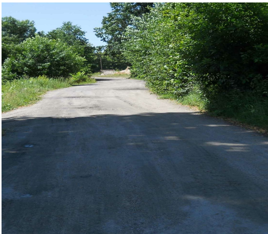
Centrum wsi, droga gruntowa