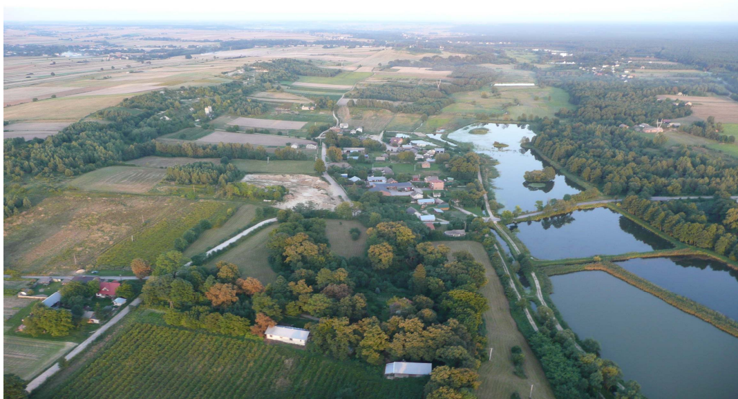
Łysaków- widok z lotu ptaka.