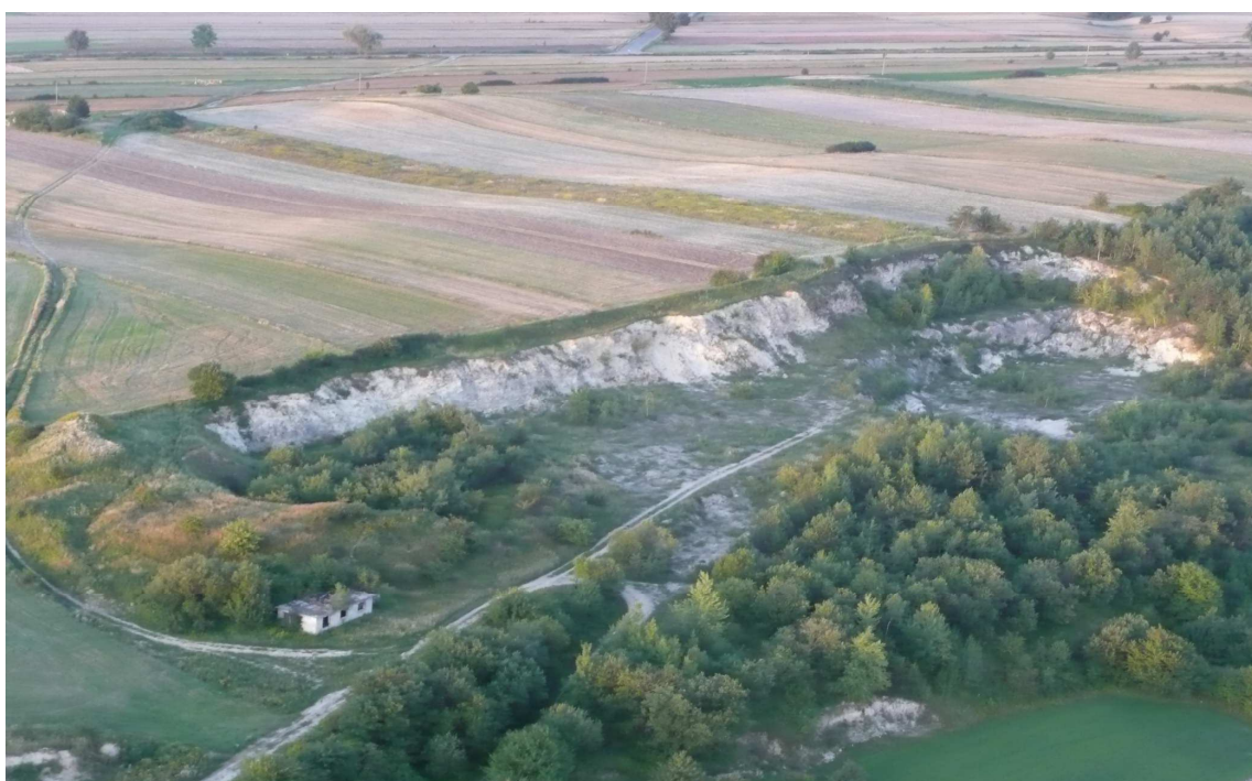
Kamieniołom w Łysakowie- widok z lotu ptaka.