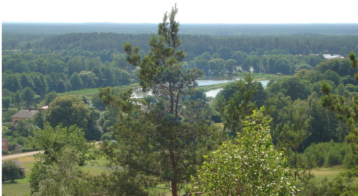
Widok na Lasy Janowskie i stawy.