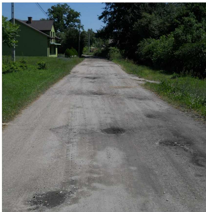
Infrastruktura drogowa na terenie sołectwa